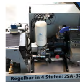
Die leistungsstarke Verdichereinheit