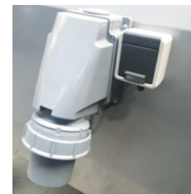
Serienmäßig mit 220 V Steckdose