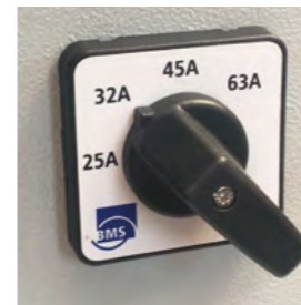
Leistung in 4 Stufen regelbar